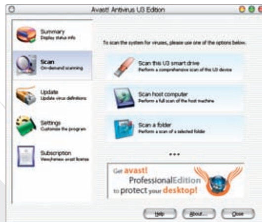
Screenshot programu avast! antivirus U3 edition (Test)